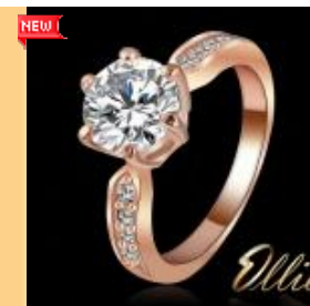
Кольцо позолоченное розовым золотом с кубическим цирконом