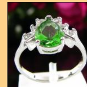
Кольцо с 9мм синтетическим зеленым изумрудом