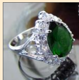
Кольцо копия "Хюррем"

Производитель: Западная Европа Наличие: В наличии