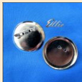
Основа под брошь, круглая