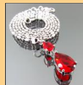
Подвеска с красным синтетическим рубином