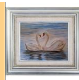
Картина акварельными красками "Лебеди"