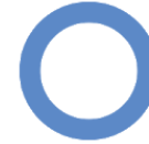
डायबिटीज़ का चिन्ह