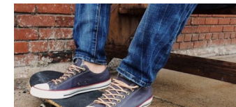
Neugestaltung der Skateranlage Wolfgang-Heinz-Str. 45 in Buch