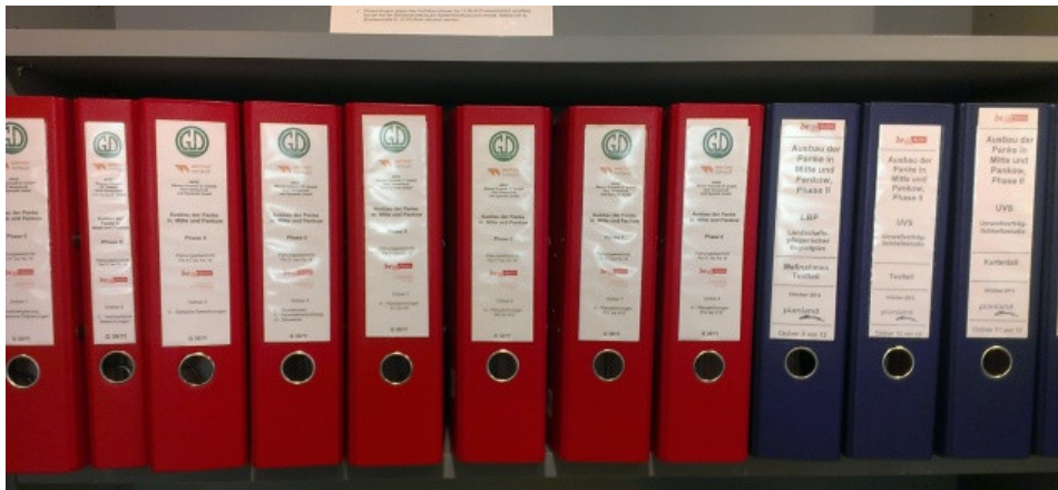
Planauslegung: Planfeststellungsverfahren 2015: Kurze Auslegung – viele Pläne, Akten und Betroffene

Nach damaligen öffentlichen Angaben „arbeiten beide Länder bei der Entwicklung des sogenannten Gewässerentwicklungskonzeptes eng zusammen.“ Für die Planung der Maßnahmen hat das Land Berlin eine Arbeitsgemeinschaft gegründet, die sich im Hinblick auf die von Brüssel gesetzte Frist „Panke 2015“ nannte.