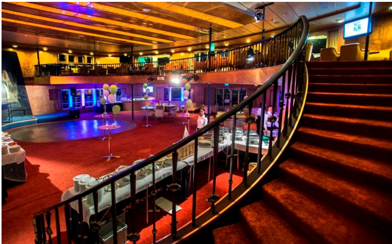
Grand Ballroom ss Rotterdam