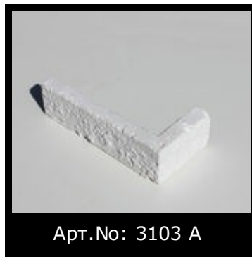
Арт.№: 3103 А