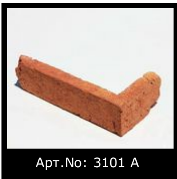
Арт.№: 3101 А