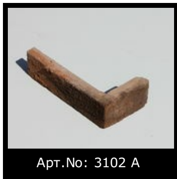
Арт.№: 3102 А