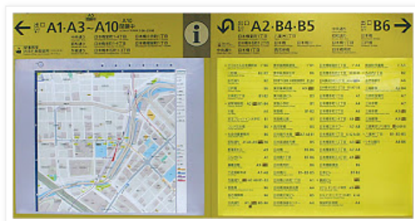
Que zonas visitar

Una vez llegamos tenemos que escoger la puerta de salida correcta...y esto es más complicado porque suelen haber dependiendo de la estación unas pocas o muchísimas.... en los sitios más turísticos suelen haber mapas que indican cual es la correcta para ir lo más rápidamente al sitio en cuestión. En cualquier caso es habitual encontrar mapas de situación indicando la salidas en un mapa.