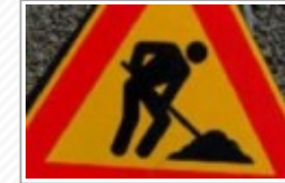
Aggiudicati i lavori sulla S.P. 12 Palma di Montechiaro – Campobello di Licata