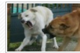
San Leone donna aggredita da randagi mentre fa jogging: salvata da passanti