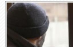
Coronavirus, quattro persone in isolamento volontario nel Nisseno: non presentano sintomi, solo precauzione