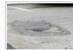
Canicatti, lavori manutenzione strade comunali interne al centro abitato