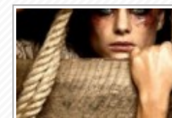
Canicatti, inaugurato uno sportello