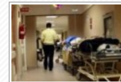
Tragedia nel Trapanese, morto sedicenne colto da malore mentre era a scuola