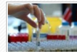
Primo caso di coronavirus in Sicilia: inutile assalto ai supermercati