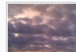
Meteo in Sicilia, da mercoledì stop al caldo anomalo