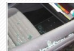
Canicattì, ladri in azione con carro attrezzi: rubata auto