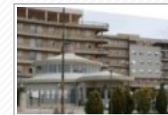
Canicattì, vertice tra il sindaco e il direttore dell'Ospedale Barone Lombardo: "Non ci sono casi di Coronavirus"