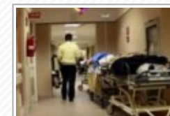
Tragedia nel Trapanese, morto sedicenne colto da malore mentre era a scuola