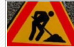
Aggiudicati i lavori sulla S.P. 12 Palma di Montechiaro – Campobello di Licata