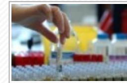
Primo caso di coronavirus in Sicilia: inutile assalto ai supermercati