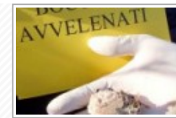
Grotte, ancora un cane avvelenato: indagini in corso