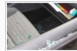
Canicattì, ladri in azione con carro attrezzi: rubata auto