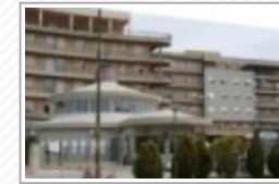
Canicattì, vertice tra il sindaco e il direttore dell'Ospedale Barone Lombardo: "Non ci sono casi di Coronavirus"