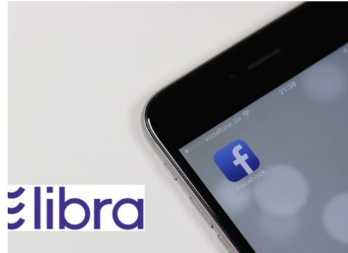
Facebook will Krypto-Weltwährung Libra einführen