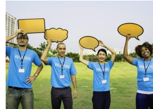
Nichtregierungsorganisationen bringen Politik in Not!

Die Reinickendorf Nachrichten sind politisch unabhängig und thematisieren Nachrichten aus dem Bezirk Reinickendorf. Die Zeitung besteht seit April 2019. Neben lokalen und kommunalen Themen werden auch allgemeine und allgemeinpolitische Themen behandelt.