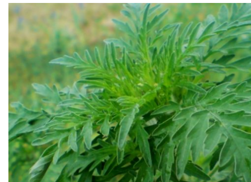
Ambrosia erkennen und bekämpfen

Die Reinickendorf Nachrichten sind politisch unabhängig und thematisieren Nachrichten aus dem Bezirk Reinickendorf. Die Zeitung besteht seit April 2019. Neben lokalen und kommunalen Themen werden auch allgemeine