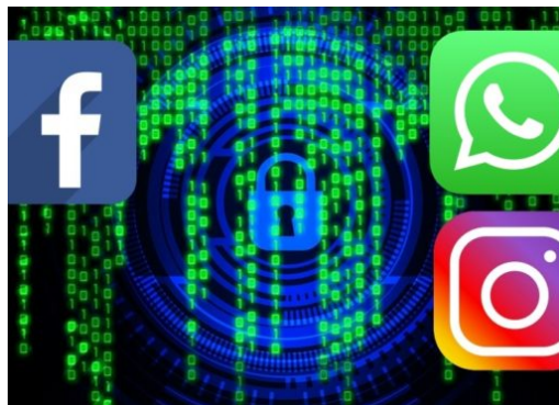
Facebook wird Instagram und Whatsapp integrieren