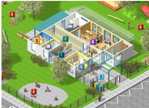
Die sichere Kita: Unfallkassen helfen dabei