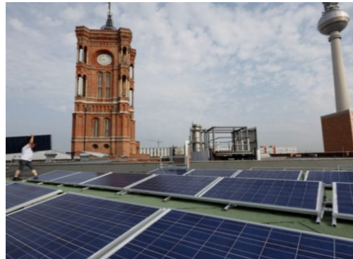
Die CO2-neutrale Berliner Verwaltung ist das Ziel