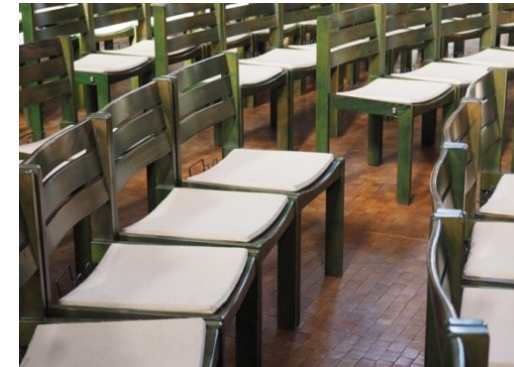
Bürgergespräch: Sicherheit und Ordnung in Tegel-Süd