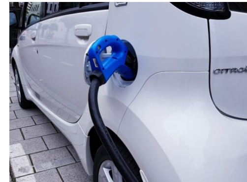
Elektroautos in Berlin fahren künftig zum Kilowatt-Tarif