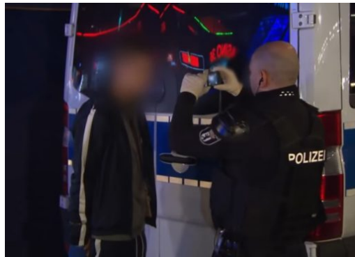
Bundesweites Vorgehen gegen Clankriminalität gefordert