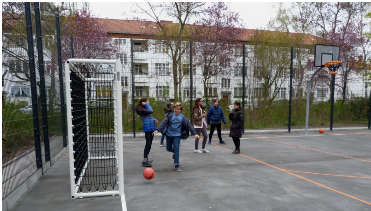
Der neue Bolzplatz im Peter-Witte-Park

„Es gibt jetzt Fahrradabstellplätze und alles ist barrierefrei zugänglich“, freute sich Katrin Schultze-Berndt. Gleichzeitig gab sie einen Ausblick auf die weiteren Planungen.