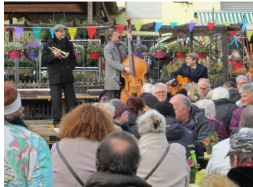
„Resi feiert Ostern“ – die Residenzstraße lädt ein!