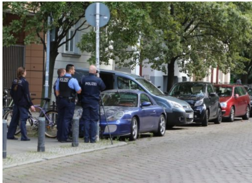
Polizei kontrolliert Verkehr und Schulwege