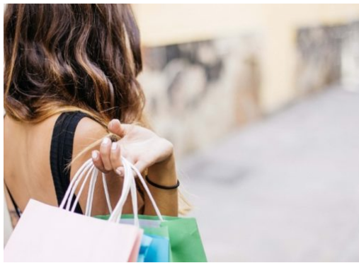
Verkaufsoffene Sonntage in Berlin im zweiten Halbjahr