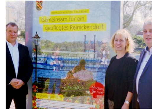
Reinickendorf macht sauber – Frühjahrsputz gestartet

Die Reinickendorf Nachrichten sind politisch unabhängig und thematisieren Nachrichten aus dem Bezirk Reinickendorf.