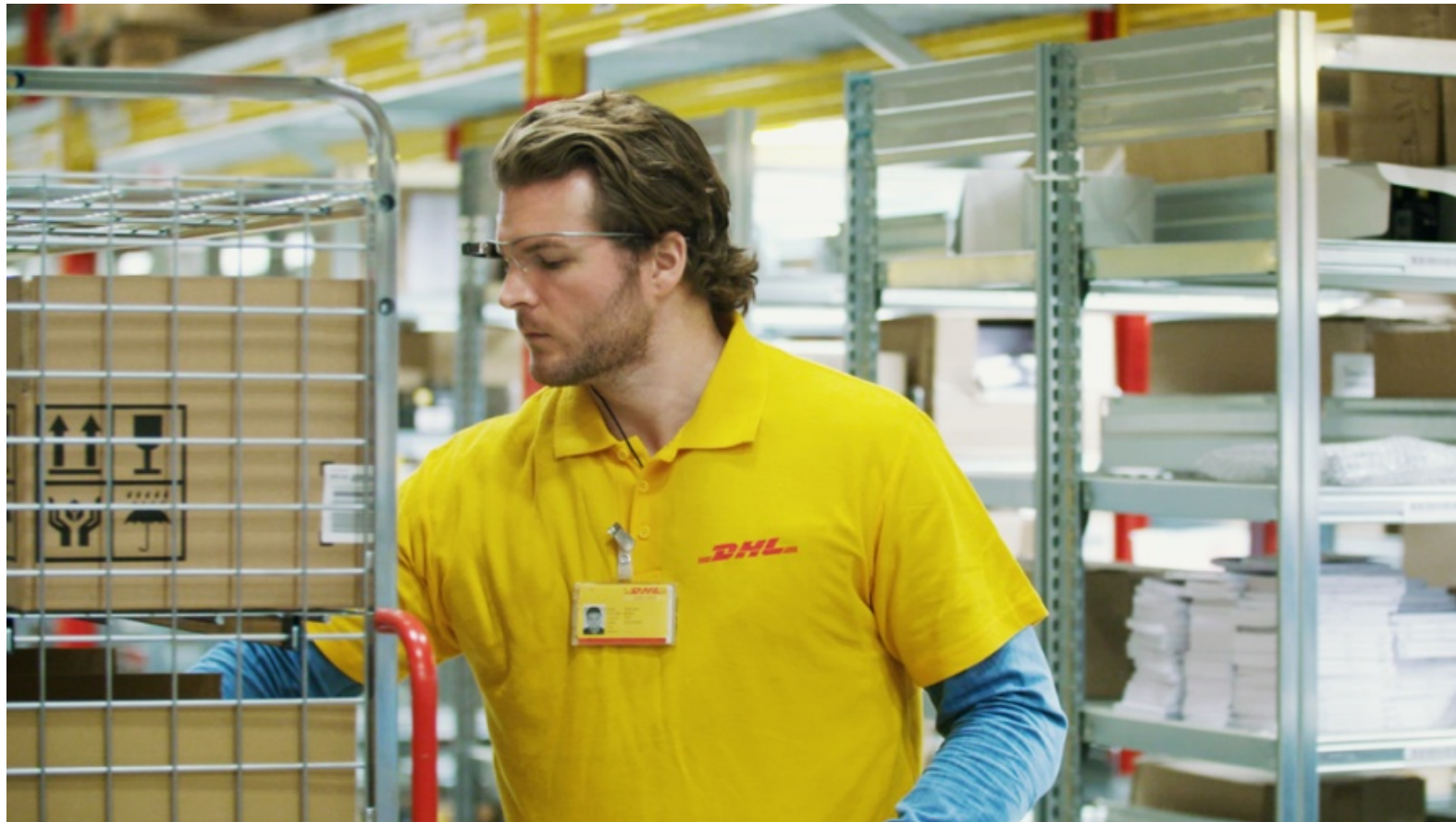
Vision-Picking mit Augmented Reality im Logistik-Hub - Foto: DHL Group

Dieses Medium ist öffentlich! Inhalte werden im Internet wiederauffindbar archiviert. Cookies werden nur aus technischen Gründen verwendet, um Zugriffs-Statistiken zu messen und um Cloud-Dienste zugänglich zu machen. Mehr Informationen siehe Datenschutz- und ePrivacy-Hinweise.