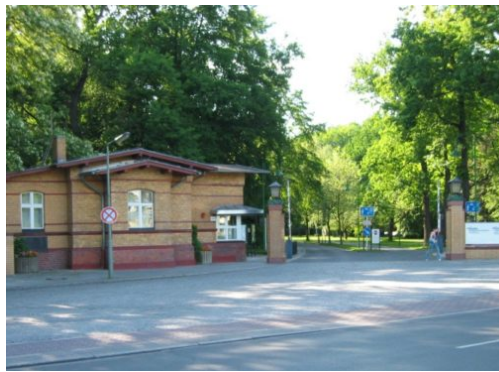
Tag der offenen Türen & Bürgerdialog am 17. Mai 2019