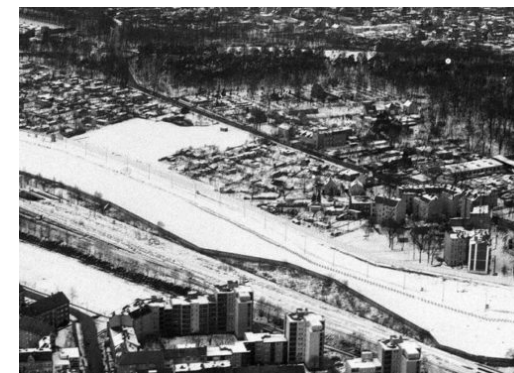
Berliner Mauer – Reinickendorf – Perspektive von innen und außen

Die Reinickendorf Nachrichten sind politisch unabhängig und thematisieren Nachrichten aus dem Bezirk Reinickendorf. Die Zeitung besteht seit April 2019. Neben lokalen und kommunalen Themen werden auch allgemeine und allgemeinpolitische Themen behandelt.