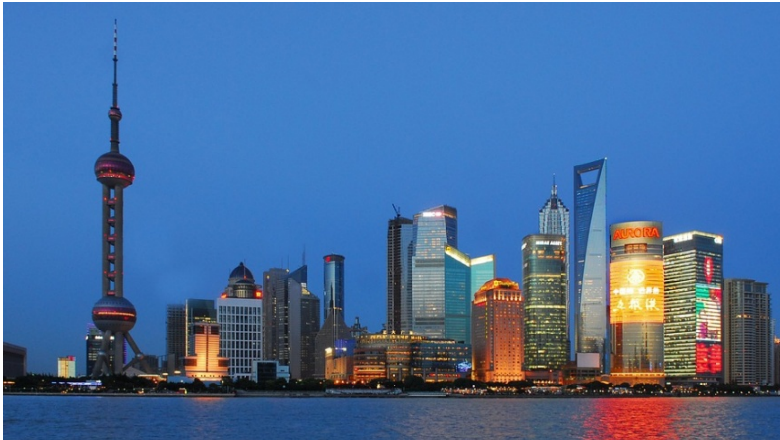
Skyline von Shanghai zur Blauen Stunde

Dieses Medium ist öffentlich! Inhalte werden im Internet wiederauffindbar archiviert. Cookies werden nur aus technischen Gründen verwendet, um Zugriffs-Statistiken zu messen und um Cloud-Dienste zugänglich zu machen. Mehr Informationen siehe Datenschutz- und ePrivacy-Hinweise.