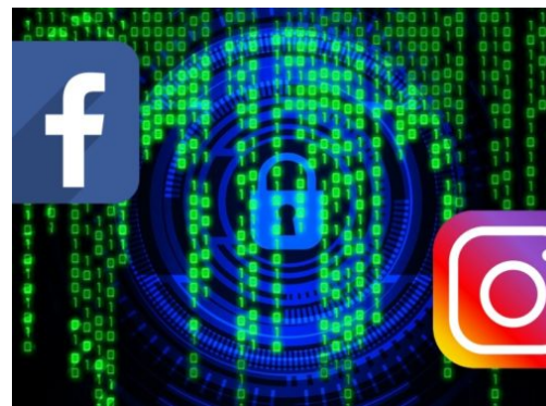
Anwalt pfändet Facebook-Geld bei CDU und SPD