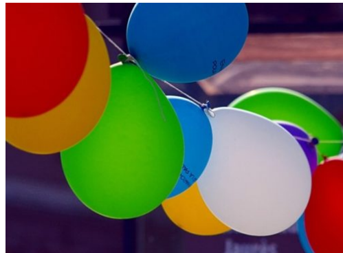
11. Kiezfest am 17. August 2019 in Tegel-Süd