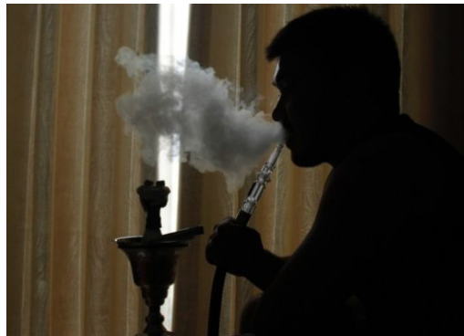
Österreich verbietet Shisha-Bars