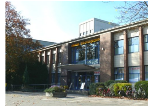
Paracelsus-Bad macht Platz für Modulare Flüchtlingsunterkunft