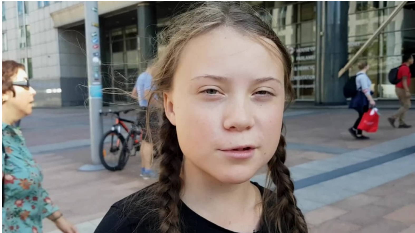
Greta Thunberg, Eleonora Emma Thunberg am 6.10.2018 in Brüssel

Dieses Medium ist öffentlich! Inhalte werden im Internet wiederauffindbar archiviert. Cookies werden nur aus technischen Gründen verwendet, um Zugriffs-Statistiken zu messen und um Cloud-Dienste zugänglich zu machen. Mehr Informationen siehe Datenschutz- und ePrivacy-Hinweise.