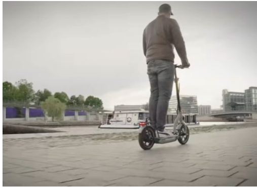
E-Scooter in Berlin – Polizei zieht Bilanz nach vier Wochen