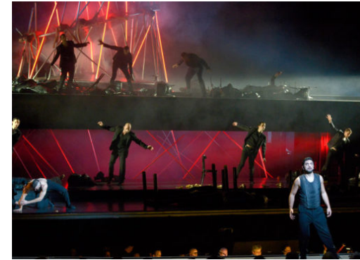
Opernsaison 2019-20: Start des Kartenvorverkaufs

Die Reinickendorf Nachrichten sind politisch unabhängig und thematisieren Nachrichten aus dem Bezirk Reinickendorf. Die Zeitung besteht seit April 2019. Neben lokalen und kommunalen Themen werden auch allgemeine und allgemeinpolitische Themen behandelt.