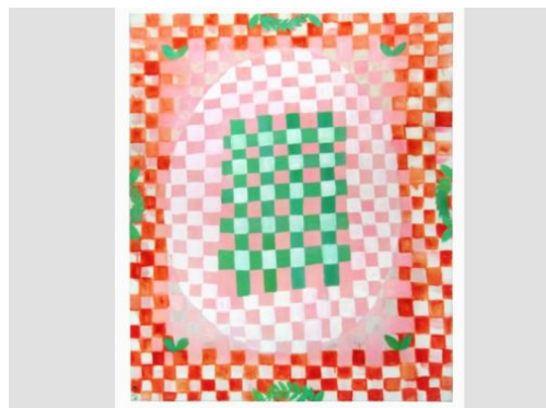
Förderpreis für junge Künstlerinnen und Künstler!