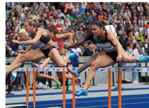
ISTAF – Leichtathletik-Meisterschaften im Olympiastadion Berlin

Die Reinickendorf Nachrichten sind politisch unabhängig und thematisieren Nachrichten aus dem Bezirk Reinickendorf.