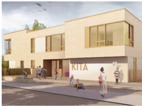
Grundsteinlegung: Kindertagesstätte Senftenberger Ring 96