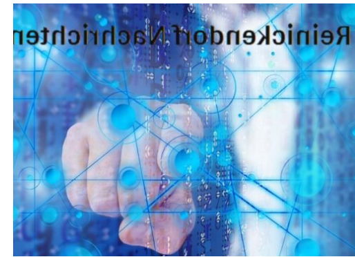
Reinickendorf Nachrichten – innovativ

Die Reinickendorf Nachrichten sind politisch unabhängig und thematisieren Nachrichten aus dem Bezirk Reinickendorf.