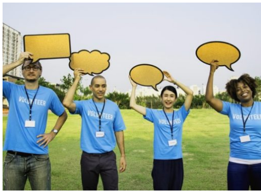
Nichtregierungsorganisationen bringen Politik in Not!