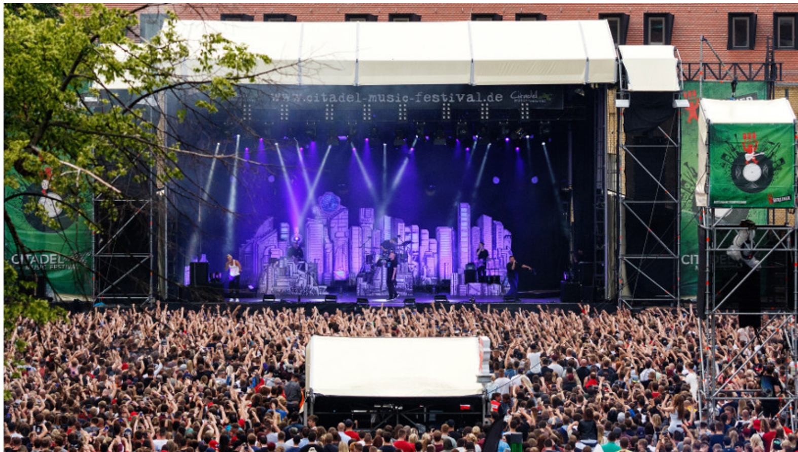
Citadel Music Festival

Dieses Medium ist öffentlich! Inhalte werden im Internet wiederauffindbar archiviert. Cookies werden nur aus technischen Gründen verwendet, um Zugriffs-Statistiken zu messen und um Cloud-Dienste zugänglich zu machen. Mehr Informationen siehe Datenschutz- und ePrivacy-Hinweise.