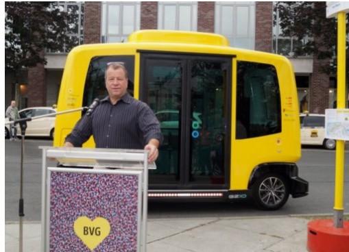
Pilotprojekt mit selbstfahrenden Minibus in Tegel gestartet