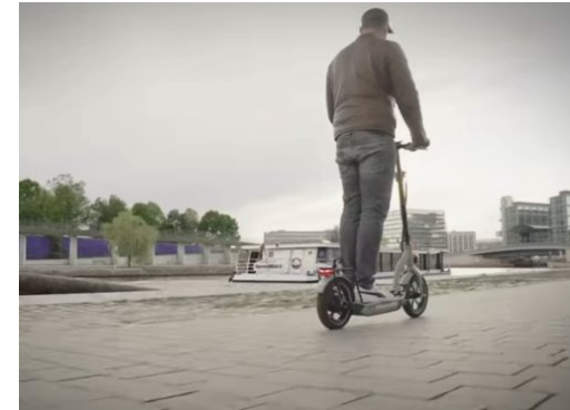
E-Scooter in Berlin – Polizei zieht Bilanz nach vier Wochen

Die Reinickendorf Nachrichten sind politisch unabhängig und thematisieren Nachrichten aus dem Bezirk Reinickendorf. Die Zeitung besteht seit April 2019. Neben lokalen und kommunalen Themen werden auch allgemeine und allgemeinpolitische Themen behandelt.