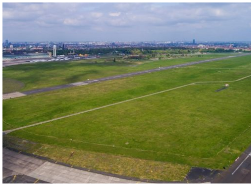
Soll das Tempelhofer Feld bebaut werden?