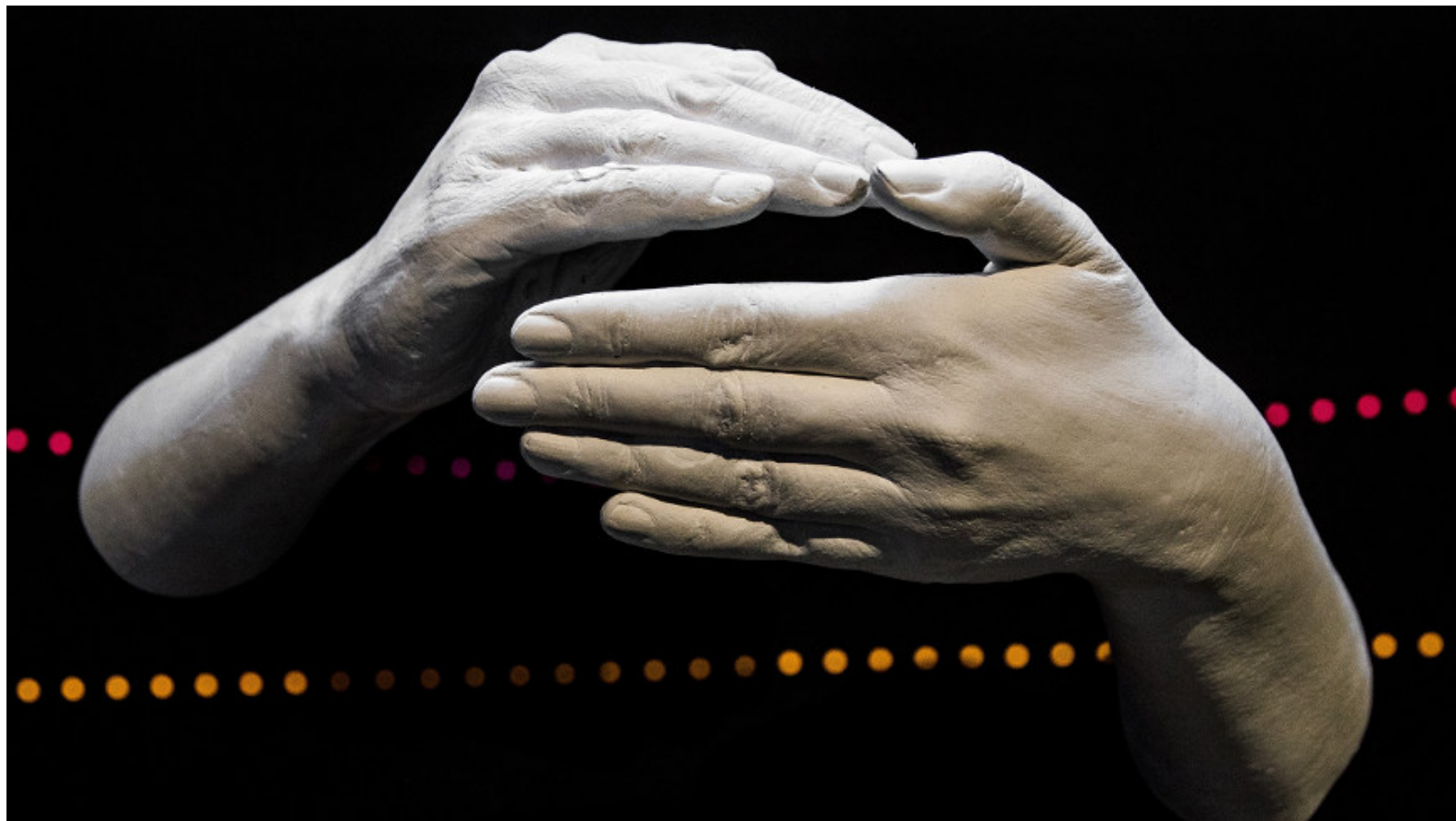
„Ausstellung im Museum für Kommunikation: Gesten – Peror“

Dieses Medium ist öffentlich! Inhalte werden im Internet wiederauffindbar archiviert. Cookies werden nur aus technischen Gründen verwendet, um Zugriffs-Statistiken zu messen und um Cloud-Dienste zugänglich zu machen. Mehr Informationen siehe Datenschutz- und ePrivacy-Hinweise .