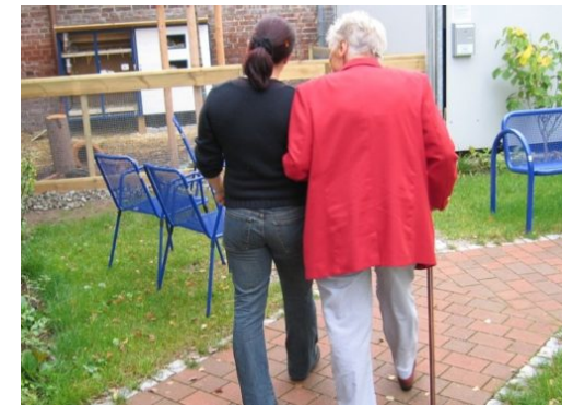
6. Bundeskonferenz „Gesund und aktiv älter werden“

Die Reinickendorf Nachrichten sind politisch unabhängig und thematisieren Nachrichten aus dem Bezirk Reinickendorf.