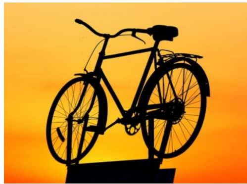
Öffentliche Informations- und Dialogveranstaltung: Radschnellverbindungen