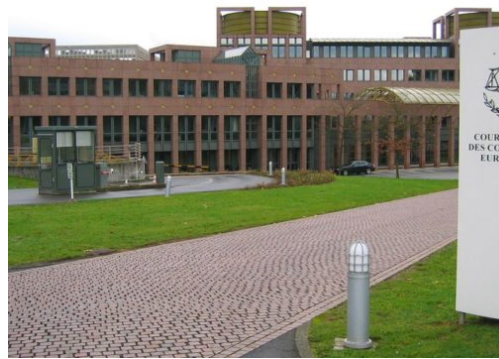
HOAI für Architekten und Ingenieure vom EuGH gekippt