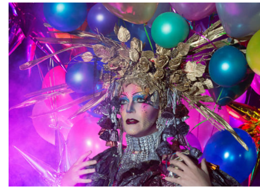
Taylor Macs Odyssee durch die US-Popgeschichte

Die Reinickendorf Nachrichten sind politisch unabhängig und thematisieren Nachrichten aus dem Bezirk Reinickendorf.