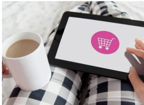
Online-Handel boomt – Einkaufsstraßen darben