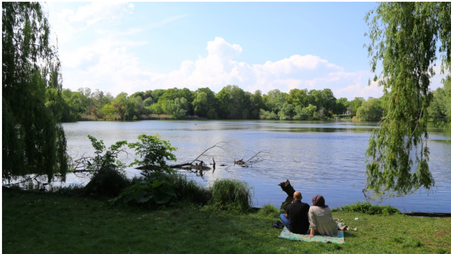
Schäfersee - Naturase mitten in der Stadt

Dieses Medium ist öffentlich! Inhalte werden im Internet wiederauffindbar archiviert. Cookies werden nur aus technischen Gründen verwendet, um Zugriffs-Statistiken zu messen und um Cloud-Dienste zugänglich zu machen. Mehr Informationen siehe Datenschutz- und ePrivacy-Hinweise .