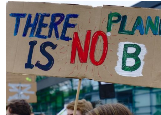
Sommerschule Klimawissen für Schülerinnen und Schüler

Die Reinickendorf Nachrichten sind politisch unabhängig und thematisieren Nachrichten aus dem Bezirk Reinickendorf.