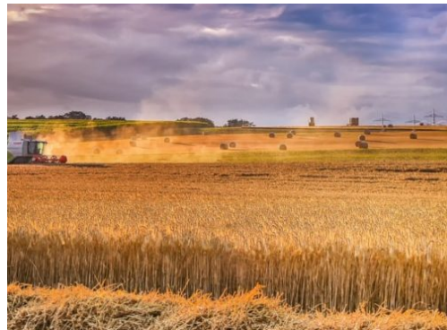
Weltweite Getreideernte reicht nicht mehr aus