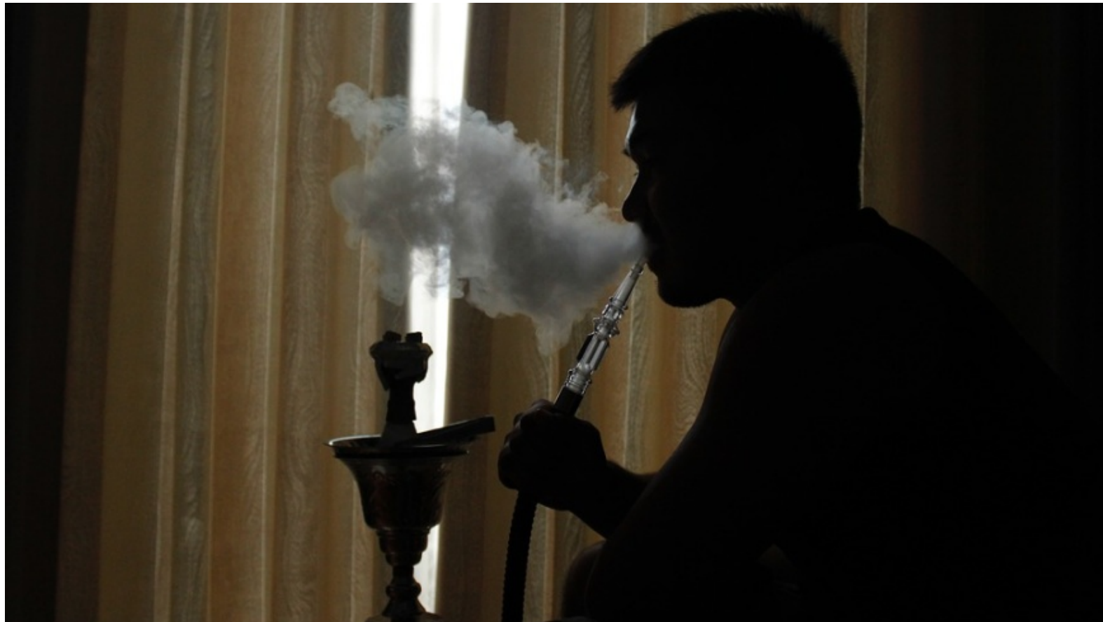
Shisha-Bars: Kohlenmonoxid, Tabakrauch, Mikroorganismen und Eiterbakterien und Legionellen - vielfältige Gesundheitsrisiken

Dieses Medium ist öffentlich! Inhalte werden im Internet wiederauffindbar archiviert. Cookies werden nur aus technischen Gründen verwendet, um Zugriffs-Statistiken zu messen und um Cloud-Dienste zugänglich zu machen. Mehr Informationen siehe Datenschutz- und ePrivacy-Hinweise .