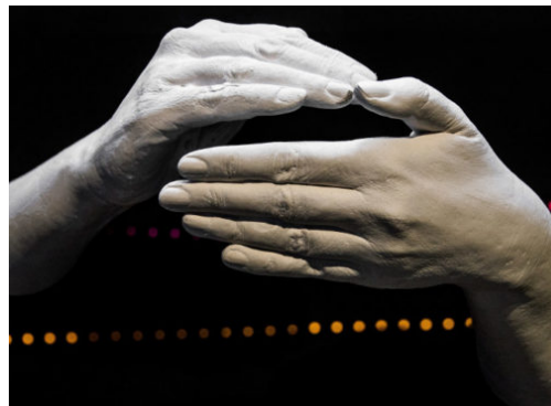
Museum für Kommunikation: „Gesten – gestern, heute, übermorgen“