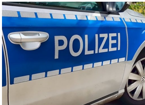
Polizeibericht vom 22.09.2019