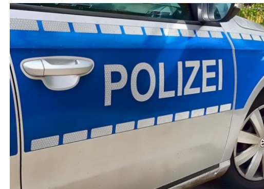
Polizeibericht vom 14.10.2019