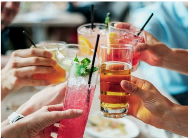
Aktionswoche Alkohol: „Alkohol? Weniger ist besser!“