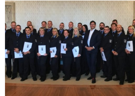
Neue Kräfte für den Justizvollzug

Die Reinickendorf Nachrichten sind politisch unabhängig und thematisieren Nachrichten aus dem Bezirk Reinickendorf. Die Zeitung besteht seit April 2019. Neben lokalen und kommunalen Themen werden auch allgemeine und allgemeinpolitische Themen behandelt.