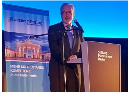
Präsident der EIB fordert mehr Wettbewerbsfähigkeit Europas