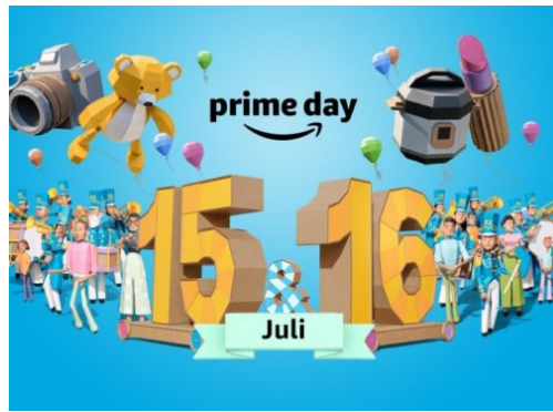
Amazon-Prime: 17,3 Mio. zufriedene Abonnenten