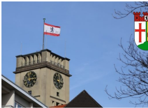
Tempelhof-Schöneberg startet die Bürgerbeteiligung 2.0