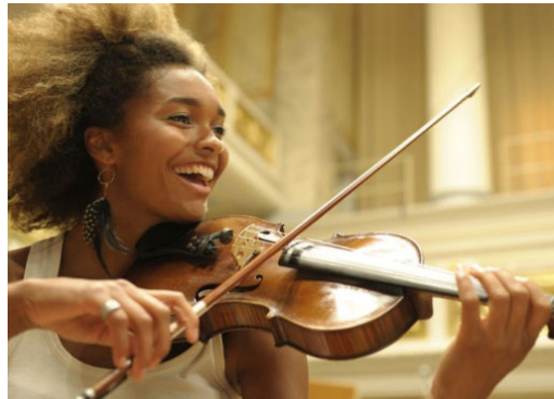
Young Euro Classics 2019