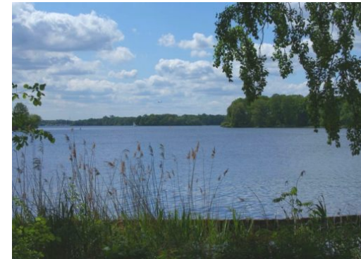
Ungeklärte Todesfälle von Hunden am Tegeler See

Die Reinickendorf Nachrichten sind politisch unabhängig und thematisieren Nachrichten aus dem Bezirk Reinickendorf.