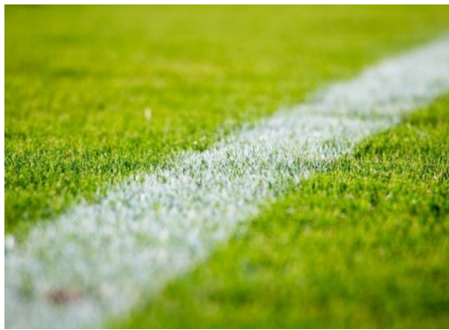
Was braucht der Sport in Reinickendorf? Einladung zum Dialog