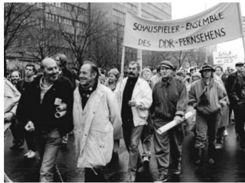
Vor 30 Jahren: der revolutionäre Moment des 4.11.1989