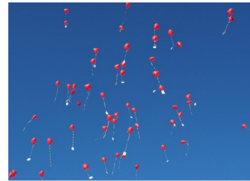
Kommt bald auch das Luftballon-Verbot in Berlin?

Die Reinickendorf Nachrichten sind politisch unabhängig und thematisieren Nachrichten aus dem Bezirk Reinickendorf.