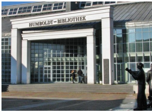
Alexander von Humboldt und die Kunst