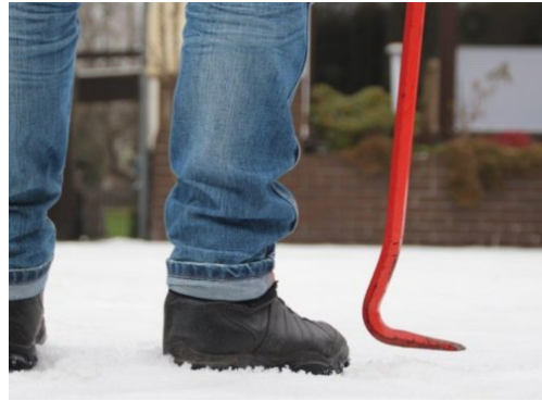
Tag des Einbruchsschutzes der Polizei Berlin