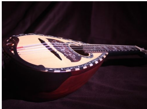
Zupforchester Da Capo: Konzert „Über sieben Weltmeere“

Neu: DB-Fernverkehrslinie Dresden-Berlin-Rostock