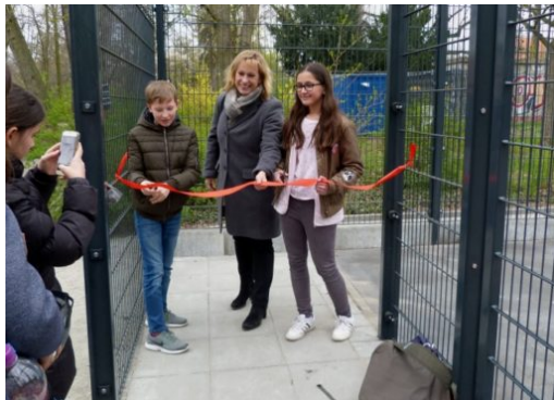
Bolzplatz Am Nordgraben/Jathoweg neu eröffnet