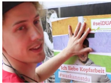
#seiDUAL: Ausbildungsplatz-Matching am 20.11.2018