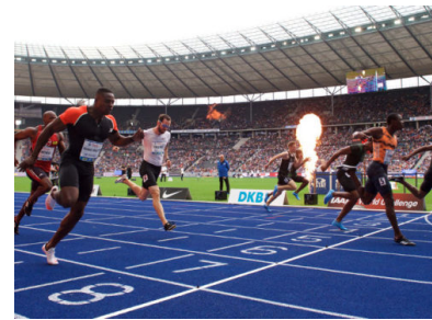
World Event ISTAF Berlin 2019