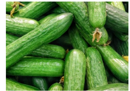
REWE spart Plastik ein bei Bio-Gurke & Co.