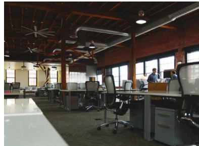
Startup.Map Berlin wird in Amsterdam gemanagt