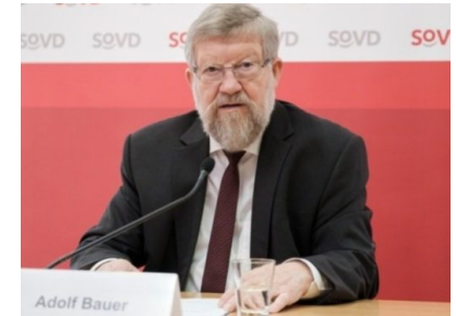
Sozialverband warnt vor Ausgrenzung und sozialer Kälte in Deutschland

Die Spandauer Tageszeitung ist politisch unabhängig und thematisiert Nachrichten aus dem Bezirk Spandau. Die Zeitung besteht seit Oktober 2018. Neben lokalen und kommunalen Themen werden auch allgemeine und allgemeinpolitische Themen behandelt.