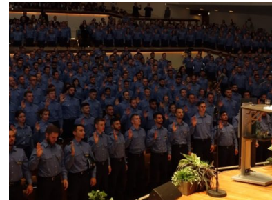
Polizei Berlin: Feierliche Vereidigung in der Philharmonie