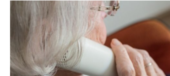
Vorsicht! Betrugsversuche mit Steuern auf Gewinnspiele!

Die Tempelhof-Schöneberg Zeitung ist politisch unabhängig und thematisiert Nachrichten aus dem Berliner Bezirk Tempelhof-Schöneberg.