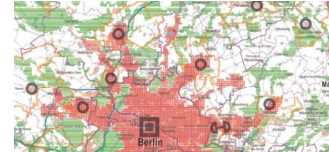
Landesentwicklungsplan Hauptstadtregion in Kraft getreten