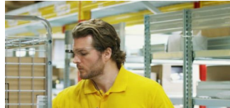
DHL setzt in der Lager-Logistik auf Datenbrillen