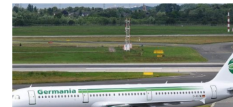
Fluggesellschaft Germania vor der endgültigen Abwicklung

Die Tempelhof-Schöneberg Zeitung ist politisch unabhängig und thematisiert Nachrichten aus dem Berliner Bezirk Tempelhof-Schöneberg.