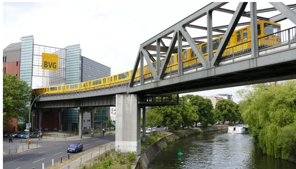
BVG vertärkt den Fahrplan in der Sylvesternacht - U2 am Gleisdreieck