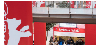
Tickets für die Berlinale jetzt kaufen