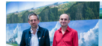
Berlinische Galerie zeigt wieder ihre Ausstellungen

Die Tempelhof-Schöneberg Zeitung ist politisch unabhängig und thematisiert Nachrichten aus dem Berliner Bezirk Tempelhof-Schöneberg.