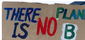
Sommerschule Klimawissen im Naturkundemuseum