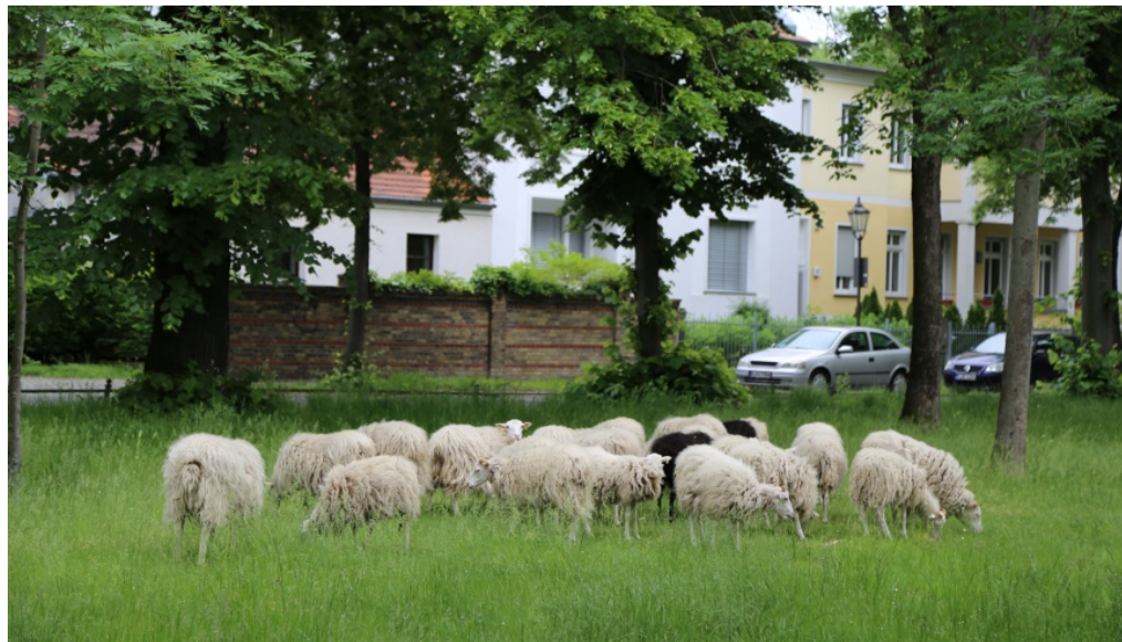
Schafe auf der Dorfaue in Lankwitz - sollen Schafe künftig Mähmaschinen und Mähhäcksler ersetzen, damit Insekten, Blumen überleben können und mehr CO2 in der Vegetation gebunden wird? Eine von vielen Ideen für 365 Days for Future in Berlin!

m/s 28. Mai 2019 Aktuell, Berlin, Natur, Slider