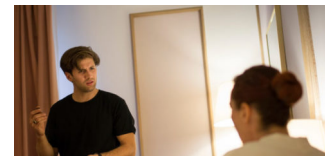
„Menschen im Hotel“ in der Vaganten Bühne