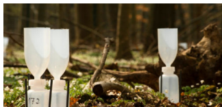
Klimaschutzwissen: Dürremonitor Deutschland