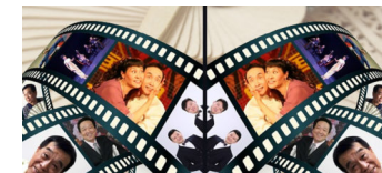
Kleinkunst aus China: 7. Quyi-Galavorführung in Deutschland

Die Tempelhof-Schöneberg Zeitung ist politisch unabhängig und thematisiert Nachrichten aus dem Berliner Bezirk Tempelhof-Schöneberg.