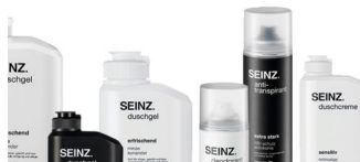
SEINZ. – der Männerbereich im Drogerie-Markt