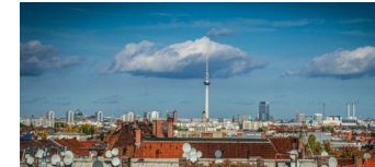
Gutachten zur rechtskonformen Umsetzung des Mietendeckels

Die Tempelhof-Schöneberg Zeitung ist politisch unabhängig und thematisiert Nachrichten aus dem Berliner Bezirk Tempelhof-Schöneberg.