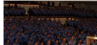
Polizei Berlin: Feierliche Vereidigung in der Philharmonie