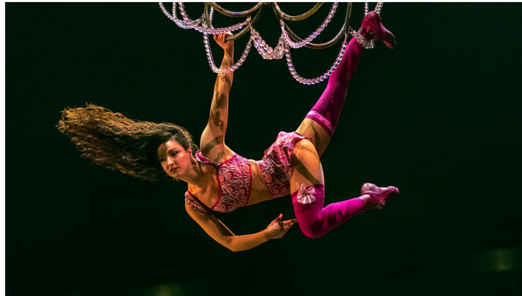
Akrobatik an der Seil-Leiter in der Show CORTEO

👤 a/m 🕒 15. Oktober 2019 📁 Berlin, Kultur, Slider