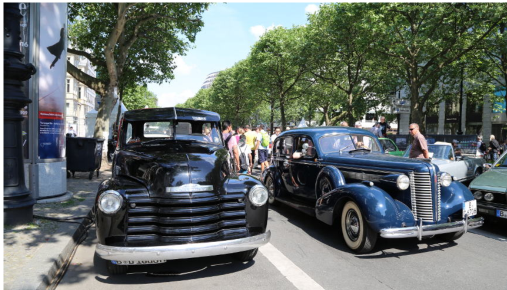
Oldtimer und Luxuskarossen auf den Classic Days - Foto: © M. Springer

a/m 🕒 7. Juni 2018 📁 Berlin, Kunst und Design, Slider