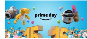
Amazon-Prime: 17,3 Mio. zufriedene Abonnenten

Die Tempelhof-Schöneberg Zeitung ist politisch unabhängig und thematisiert Nachrichten aus dem Berliner Bezirk Tempelhof-Schöneberg.