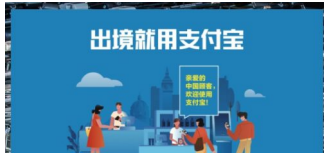
Alipay: ab sofort neu in allen dm-Märkten