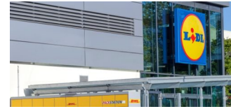
Bei Lidl einkaufen und gleich DHL Pakete abholen