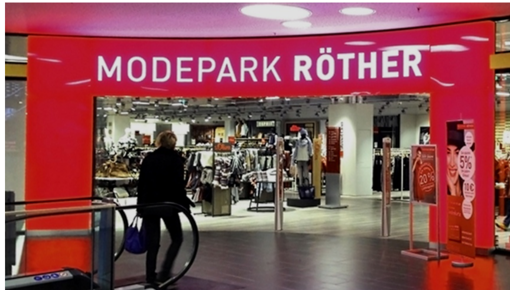
Eingang von Modepark Röther im Hansa-Center in Hohenschönhausen - Foto: www.modepark.de